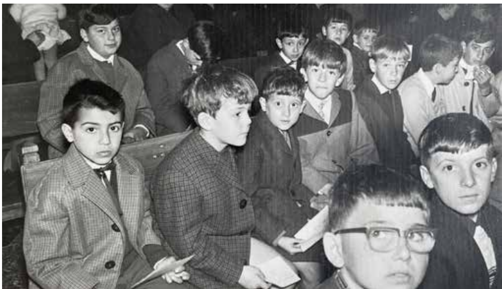
Nins, grans i petits, el dia de la confirmació. 28 de febrer de 1968.