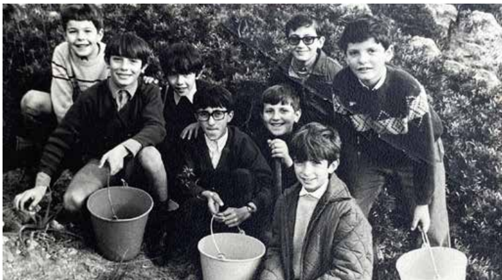
L'any 1971, el de la sembrada de pins a Consolació, amb companys del col·legi Bisbe Verger.